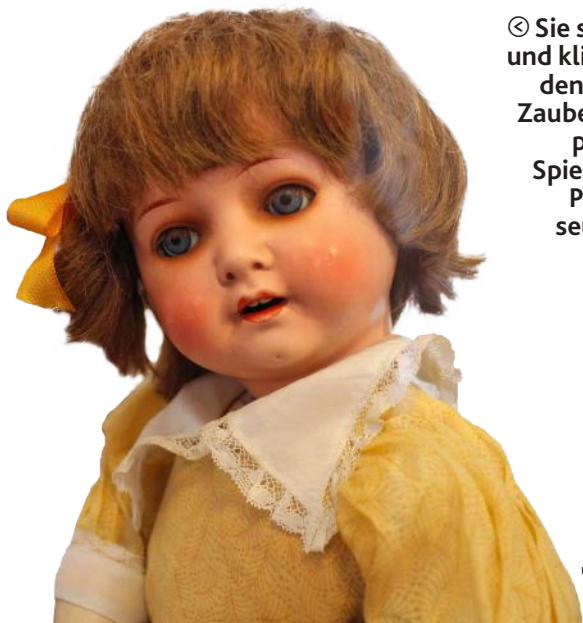
⌚ Sie sagt Mama und klimpert mit den Wimpern: Zauber der Puppenwelt Im Spielzeug- und Puppenmuseum Baden.