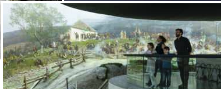
Das Riesenrundgemälde am Bergisel lädt zum Staunen ein.

torischen Tirol befindet sich im Volkskunstmuseum. Im Tirol Panorama lädt das Riesenrundgemälde ein.