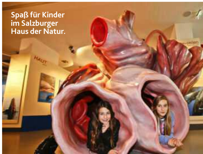
Spaß für Kinder im Salzburger Haus der Natur.