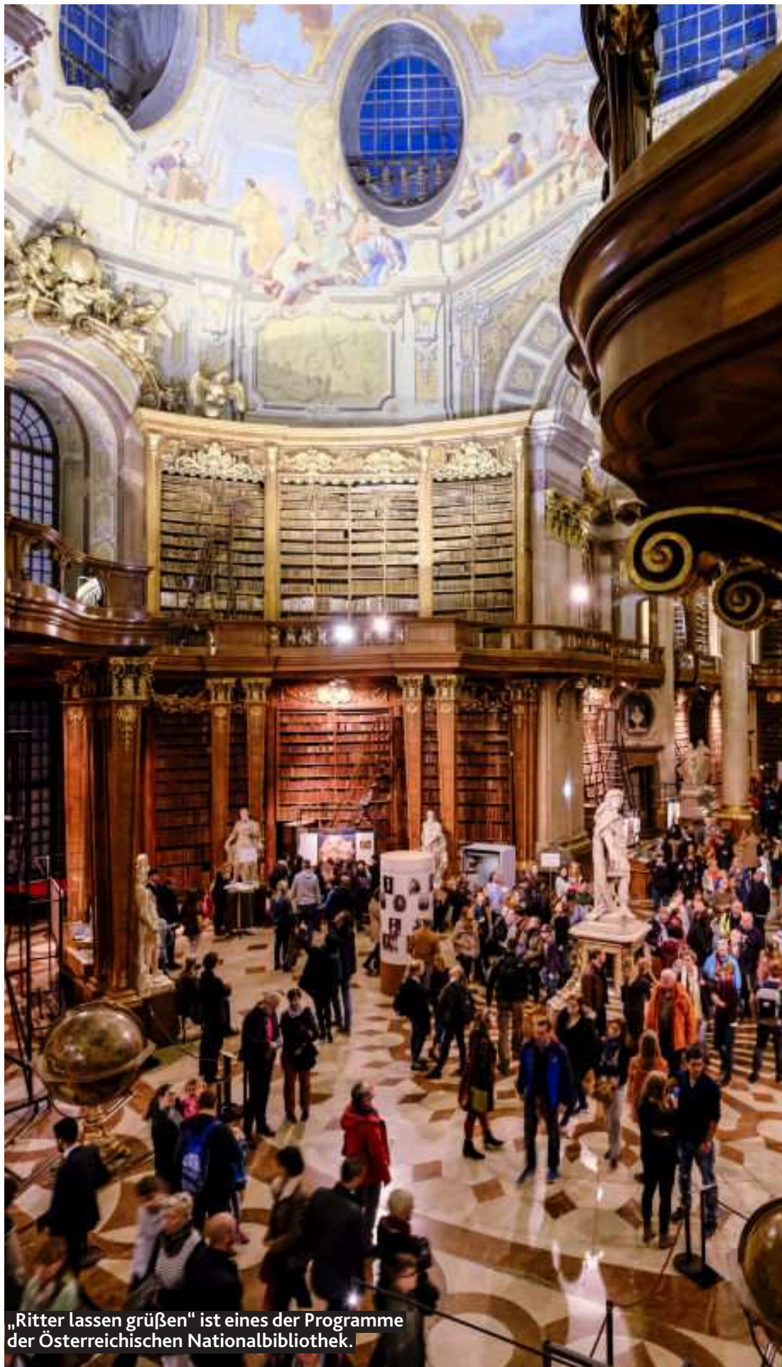
„Ritter lassen grüßen“ ist eines der Programme der Österreichischen Nationalbibliothek.