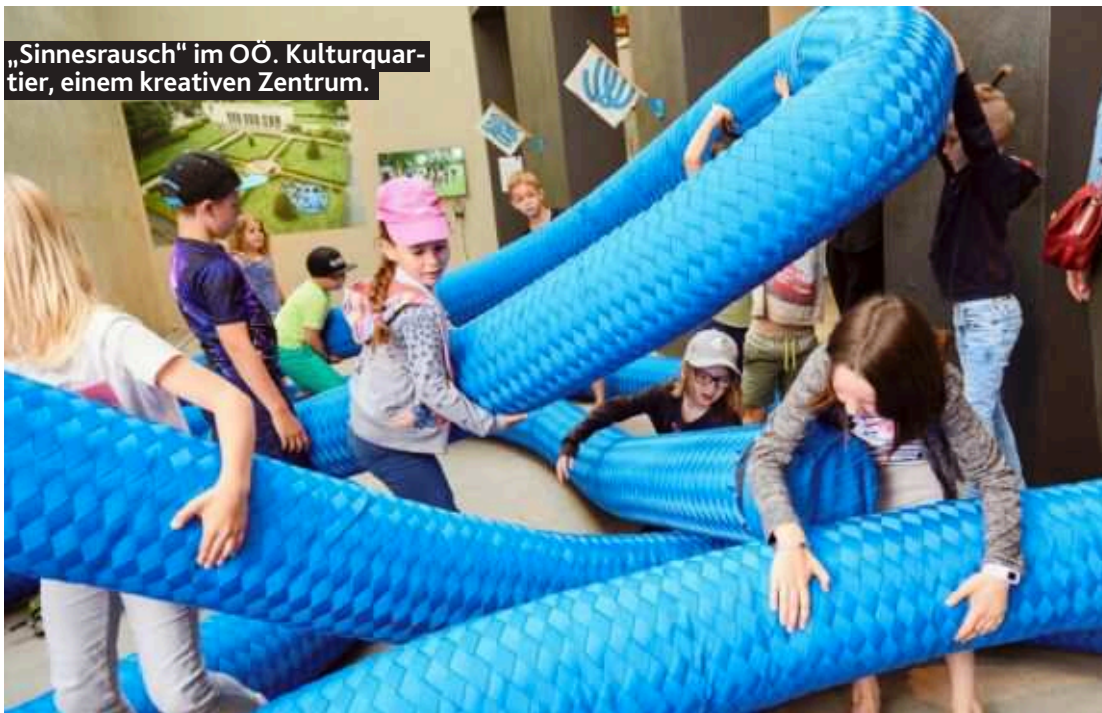
„Sinnesrausch“ im OÖ. Kulturquartier, einem kreativen Zentrum.

Dr. Alexander Wrabetz, ORF-Generaldirektor