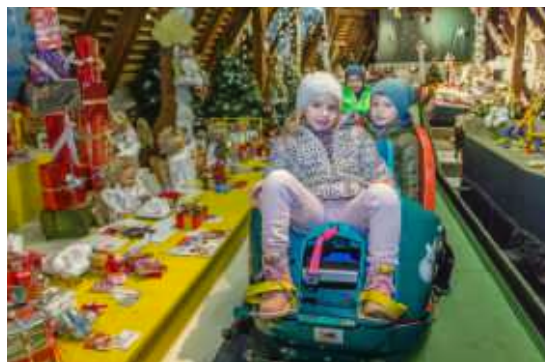
⌚ Weihnachts-glitter im Weihnachtsmuseum, Steyr (OO).