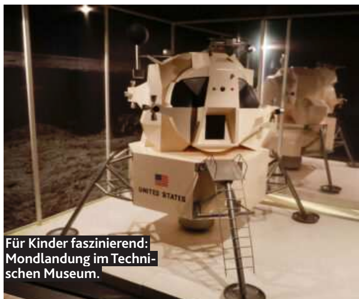
Für Kinder faszinierend: Mondlandung im Technischen Museum.